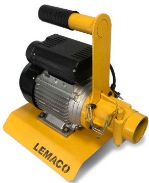
Unidad motriz monofásica 2 HP Motor para trabajo pesado

· Tipo universal, apto para unidades motrices eléctricas o bencineras: