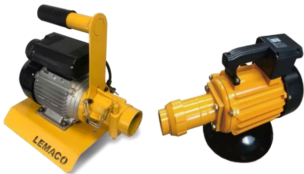
Unidad motriz monofásica 2 HP Motor para trabajo pesado

• Tipo universal, apto para unidades motrices eléctricas, bencineras o diésel: