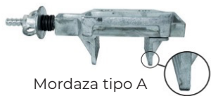
Mordaza tipo A