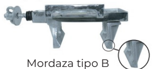
Mordaza tipo B